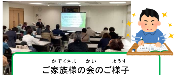
かぞくさま かい ようす ご家族様の会のご様子