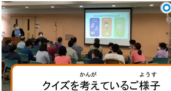
かんが ようす クイズを考えているご様子