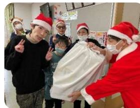
サンタさんからの プレゼント♡