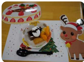
ババロアにデコレーション。 フルーツ、ホイップお好みで♪