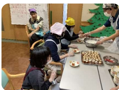
クリスマス会の様子