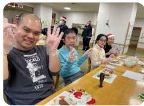
クリスマス会の様子♪