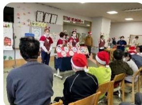
ハンドベル演奏会