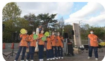
さくねん しゃしん ※昨年の写真です。