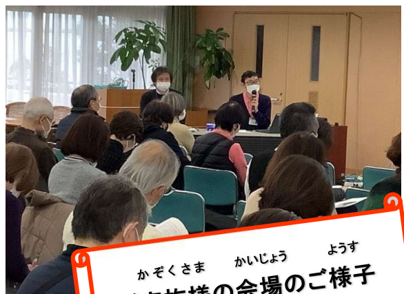
かぞくさま かいじょう ようす ご家族様の会場のご様子