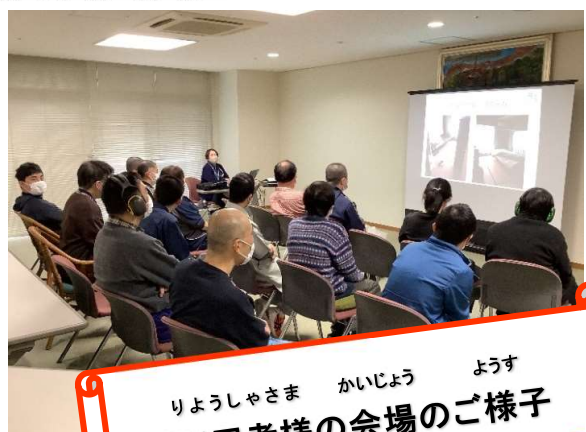
りようしゃさま かいじょう ようす ご利用者様の会場のご様子