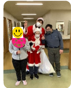
サンタとはい！ちーず！