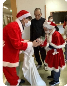
サンタからプレゼントを もらいました♪