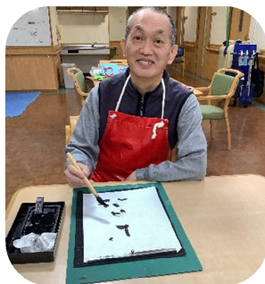
かきぞ 書初めましたよ！