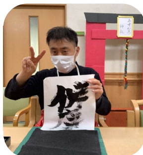
じょうず か 上手に書けました！