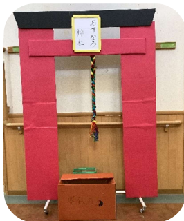
みんな つく とりい 皆で作った鳥居！