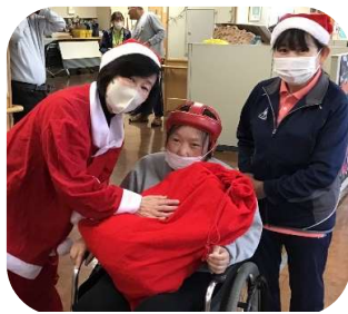
クリスマス会は劇や出し物で大盛り上がり♪