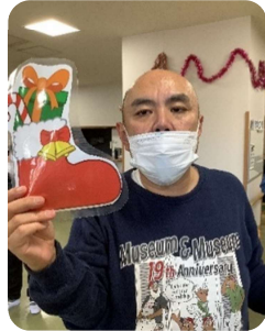
たからさが 宝探しゲームでゲット！