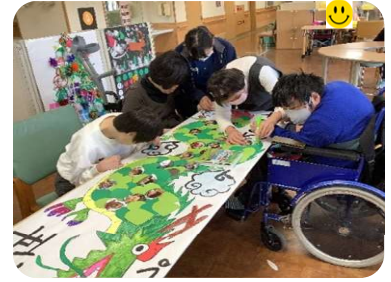
たつとし む じゅんびちゅう 辰年に向けて準備中です！