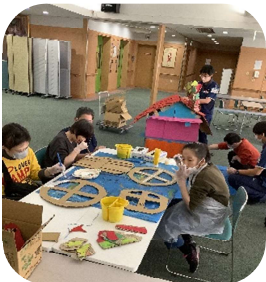
もり いえ せいさくちゅう 森の家 制作中♪