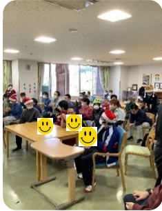
かんしょう 鑑賞タイム♪