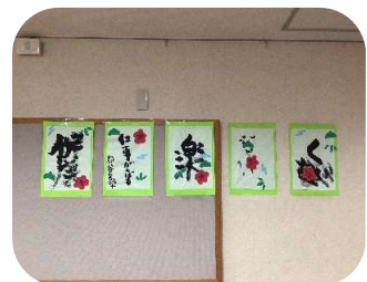
みんな さくひん かざ 皆の作品を飾ったよ！