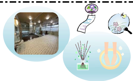
担当: 澤田・中内・奥田・石本

7月24日(月)~29日(土)の期間、生活介護で入浴サービスを利用しているご利用者様を対象に、ハッカ風呂を開催しました。「いつもの入浴+ハッカ湯の足湯とかけ湯」と、ご利用者様から笑顔で「ひんやりして気持ちいいわ!」と感想を頂きました。ハッカ風呂は手軽に爽快感が味わえておススメです。ぜひご自宅でもお試し下さい♪