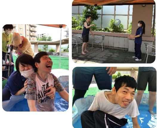
担当: 秋本・川村・井川

7月19日(水)、26日(水)に水レクリエーションを行いました。天気予報は曇りでしたが当日は快晴の中、開催する事が出来ました。プールに浸かったり水鉄砲やホースで水を掛け合ったりと、盛り上がりました。プールに浸からないご利用者様もプールに足を浸けたり出したり、ビーチボールでビーチバレーをしたり、楽しまれていました。皆様に感想をお伺いすると「気持ち良かった!」「もっとやりたいな!」とお話されていました。