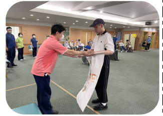
ひょうしょうしき 表彰式