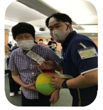
か ものきょうそう 借り物競争