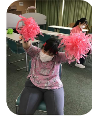
おうえんがっせん 応援合戦